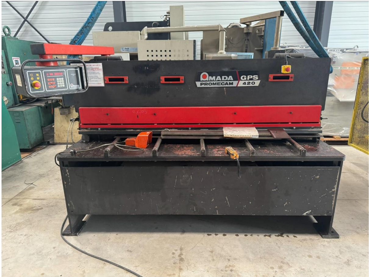
Cisaille hydraulique AMADA GPS 420

Reprise et renouvellement de vos machines-outils